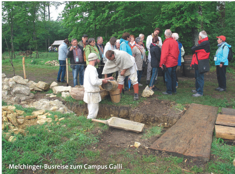
Melchinger-Busreise zum Campus Galli