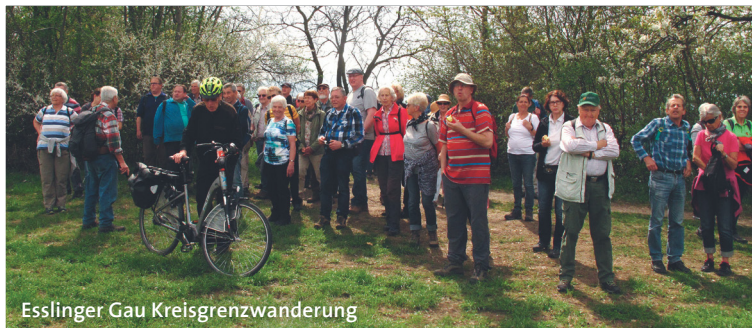
Esslinger Gau Kreisgrenzwanderung