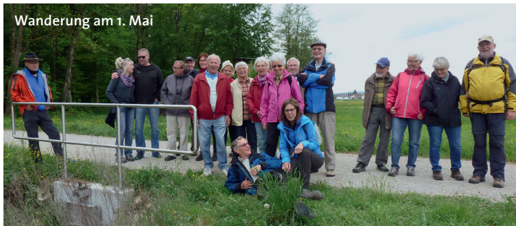
Wanderung am 1. Mai