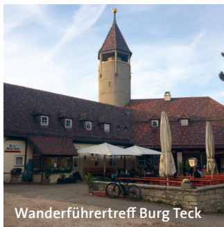
Wanderführertreff Burg Teck