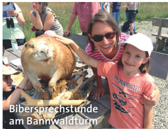
Bibersprechstunde am Bahnwaldturm