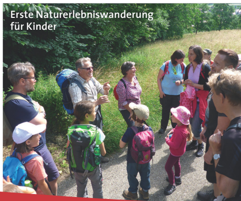
Erste Naturerlebniswanderung für Kinder